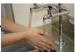
8. 流水で洗い流し た後、ペーパータ オル等で拭く