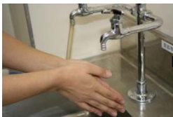
1. 流水で洗い石鹸 をつける