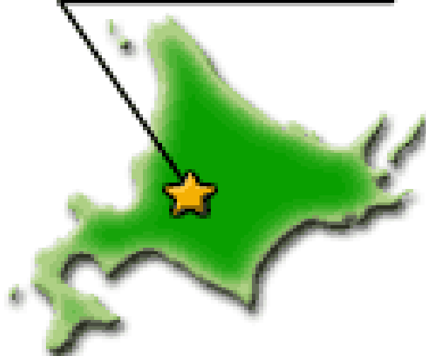
芦別市の気温と降水量