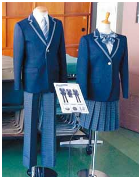
「星の降る里」から連想した紺色のブレザータイプの制服となっています。