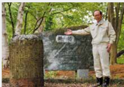
6月9日、50年前に旭ヶ丘公園内に埋設されたタイムカプセルの発掘作業に立ち合わせていただきました。