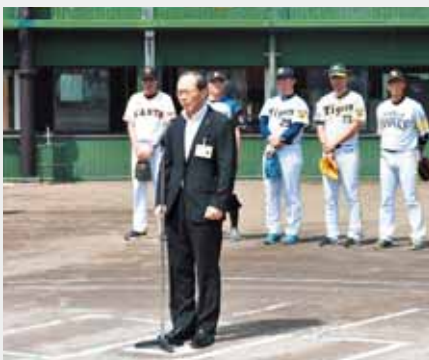
日本プロ野球OBクラブベースボールサマーキャンプには、道内外から多くの青少年女たちに参加していただきました。

短い期間ではありましたが、当地での強化トレーニングが、チームスローガンに掲げられた「 継勝 」につながり、