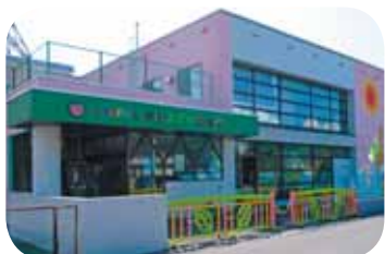
認定こども園芦別みどり幼稚園

入所を申し込む場合は、子ども・子育て支援新制度に基づく教育・保育給付認定（保育の必要性の認定等）を受ける必要があります。また、市内居住のかたは、入所申請と同時に教育・保育給付認定申請も受け付けます。