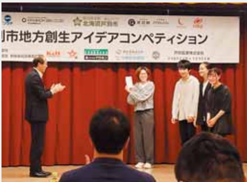
9月16日、「地方創生アイデアコンペティション」に参加し、貴重な提言をいただき、今後のまちづくりの参考にさせていただきます。

同楽団は、音楽を愛する市民の皆様により設立され、これまで定期演奏会をはじめ市内小中学校、高等学校との合同演奏会や、芦別健夏まつりなど各種イベントでの演奏活動を通じて本市