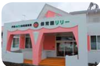
芦別みどり幼稚園附属保育園リリー