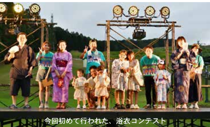
今回初めて行われた、浴衣コンテスト

8月3日、「キラキラ☆フェスタあしべつ2024」が国設芦別スキー場特設会場で開催されました。