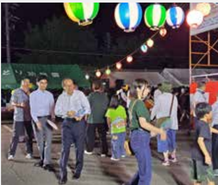
本町地区「納涼盆踊り」では、皆さんとともに、楽しいひと時を過ごさせていただきました。

本キャンプへの参加希望が多く、好評なことからも、公益社団法人全国野球振興会様をはじめ関係者皆様のご支