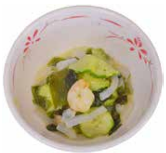
1人分のカロリー 【37Kcal】 提供：野口病院

こんにゃくやワカメに含まれる食物繊維は胃や腸で消化されないまま腸に入り、水分を吸収して膨らんで腸内を移動する間に便を軟らかくして老廃物をスムーズに排泄しお通じを助ける働きがあります。