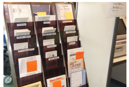
1階ホールのパンフレット棚