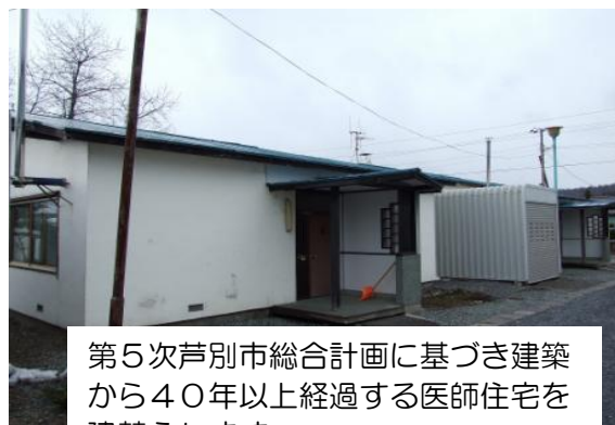
第5次芦別市総合計画に基づき建築から40年以上経過する医師住宅を建替えます

経営改善に当たっては、10年ぶりのプラス改定となった診療報酬改定により増収が期待される一方で、依然として患者数の減少傾向が続いているなど経営環境は厳しく、休床病床のあり方の検討を含め、21年3月に策定した「市立芦別病院改革プラン」に掲げた計画の達成に向け、更なる経営健全化に向けて努力してまいります。