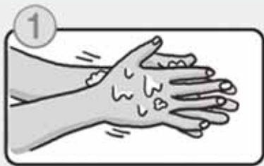
流水でよく手をぬらした後、石けんをつけ、手のひらをよくこすります。