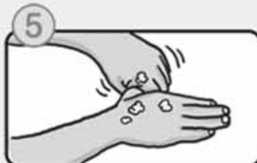
親指と手のひらをねじり洗いします。