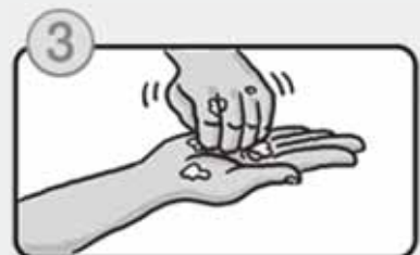
指先・爪の間を念入りにこすります。