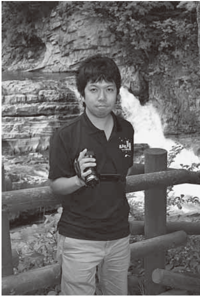
芦別の魅力を探り出し、多くの方に伝えるため、芦別市内をくまなく歩いています=三段滝にて

芦別観光を盛り上げるには、多くの方の協力が必要だと思えますので、街やイベント会場で私を見かけたら、気軽に声をかけ、意見をお聞かせください。