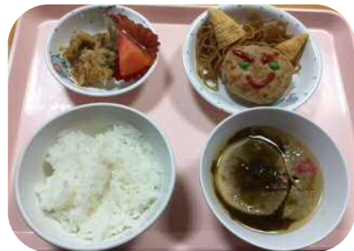
豆まき給食「鬼バーグ」(つばさ保育園)