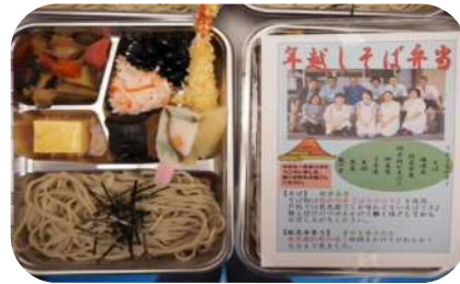
イベント弁当(芦別慈恵園)

「第3次芦別市食育推進計画」の全文は、芦別市ホームページよりご覧になることができます。