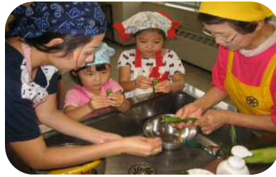
食育体験会(健康推進課)