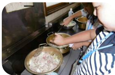
通学合宿(生涯学習課)