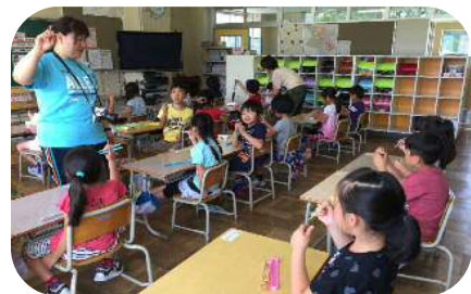
食に関する授業「お箸の使い方」(芦別小学校)