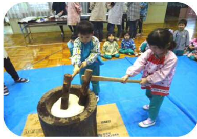
もちつき会(芦別みどり幼稚園)