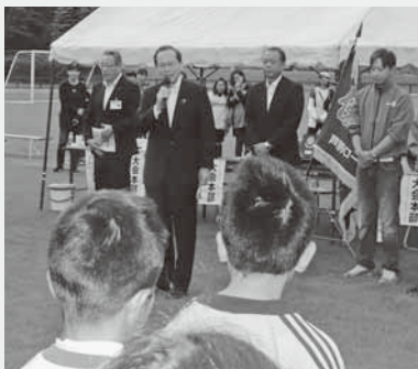
なまこ山総合運動公園で、「第4回芦別ロータリークラブ杯北空知U-10少年サッカー大会」が開催されました。

「防災の日・防災週間」に合わせ、8月30日、「大雨による洪水」、「土砂災害」を想定した防災訓練を実施し、訓練会場となりまして上芦多目的研修センターと周辺において、避難、応急救護、水防などの訓練のほか、市役所では、災害対策本部員による図上訓練を行いました。参加協力いただいた上芦別地区町内会の皆さんをはじめ防災関係機関との連携により、迅速に対応ができるよう、防災講話や情報の伝達、安否確認の訓練なども同時に行ったところです。万一にも、災害が起きた時の行動や普段の備えなど、平時から市民の皆さんご自身の備えはもちろんのこと、地域の備えにも目を向けていただくことが大切です。市としても、市民の皆さんが迅速に安全に避難できるよう、また、防災関係機関と連携し、災害を最小限に食い止めることができるよう、これからも防災訓練等を通じ、防災・減災対策に取り組んでまいります。