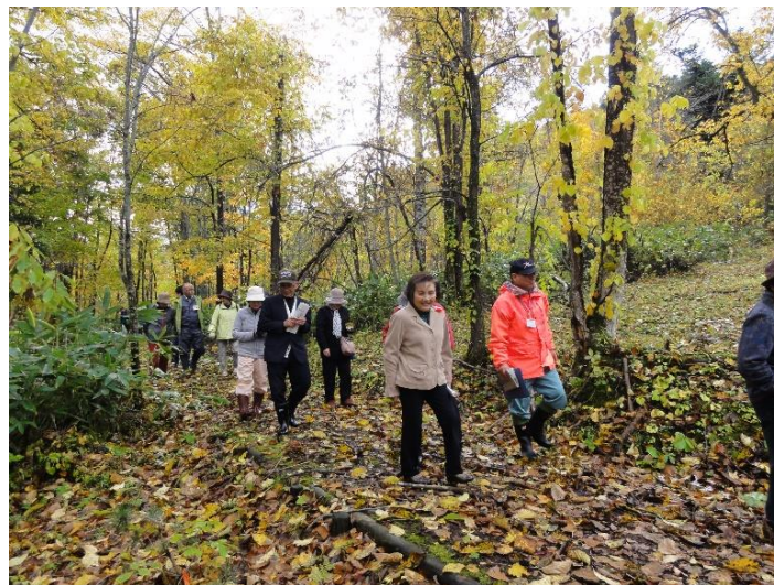
【生活環境保全林の活用】