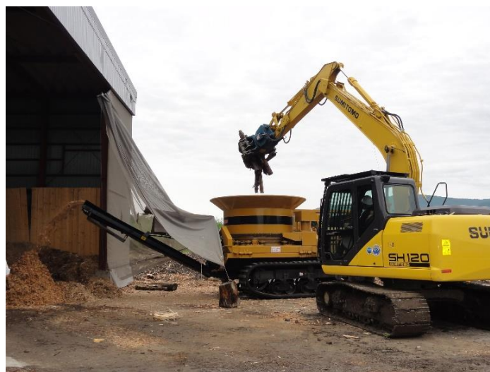
【木質バイオマスの活用】