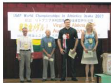
2007 リトアニア共和国陸上選手団 2007 Lithuanian Athletics Team