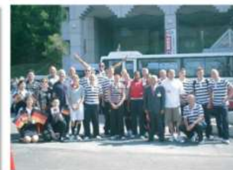
2008 ドイツ陸上競技選手団 2008 German Athletics Team