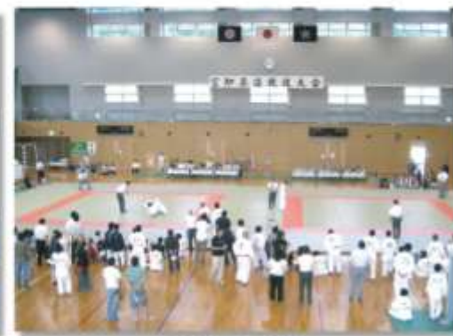
柔道大会の様子 Judo Tournament