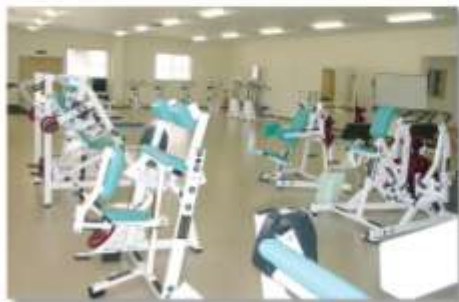
トレーニングルーム Training Room