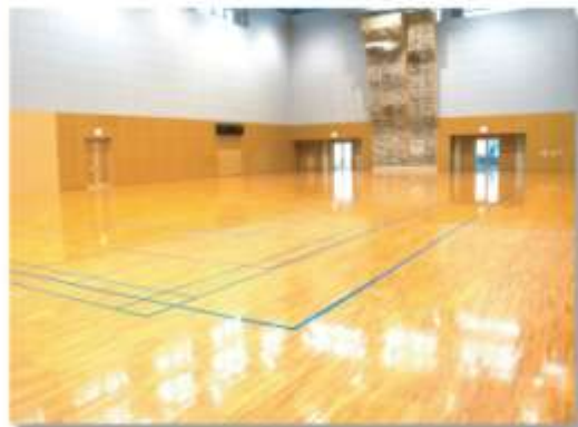
サブアリーナ Sub Arena

なまこ山総合運動公園内にある総合体育館。バスケットボールコート2面がとれるメインアリーナは、ランニングコースも備え、サブアリーナ、会議室も完備しています。毎年、多くの団体が合宿で利用するほか、各種大会にも利用されています。