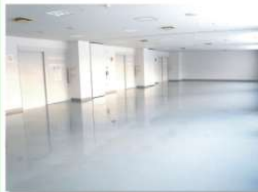
会議室 Meeting Room

Volleyball, Futsal (Indoor Soccer), Table Tennis, Judo, Handball, Sitting Volleyball, Wheelchair Basketball