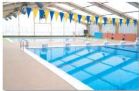
B & G 海洋センタープール B&G Ocean Center Pool