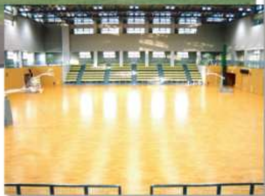
メインアリーナ Main Arena