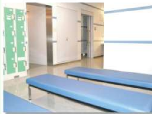
更衣室 Changing Rooms