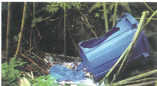
ヒグマに荒らされたゴミバケツ

実際に平成11年～21年度に渡島半島地域で銃器によって捕獲されたヒグマ586個体の胃袋を分析した結果、7.0%に当たる42個体からゴミ袋が出現しました。